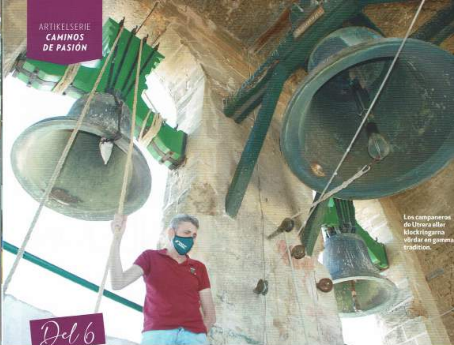
Los campaneros de Utrera eller klockringarna värddar en gammal tradition.