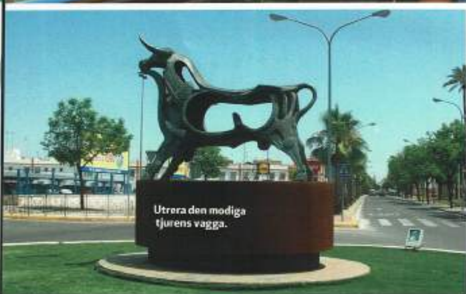
Utrera den modiga tjurens vagga.