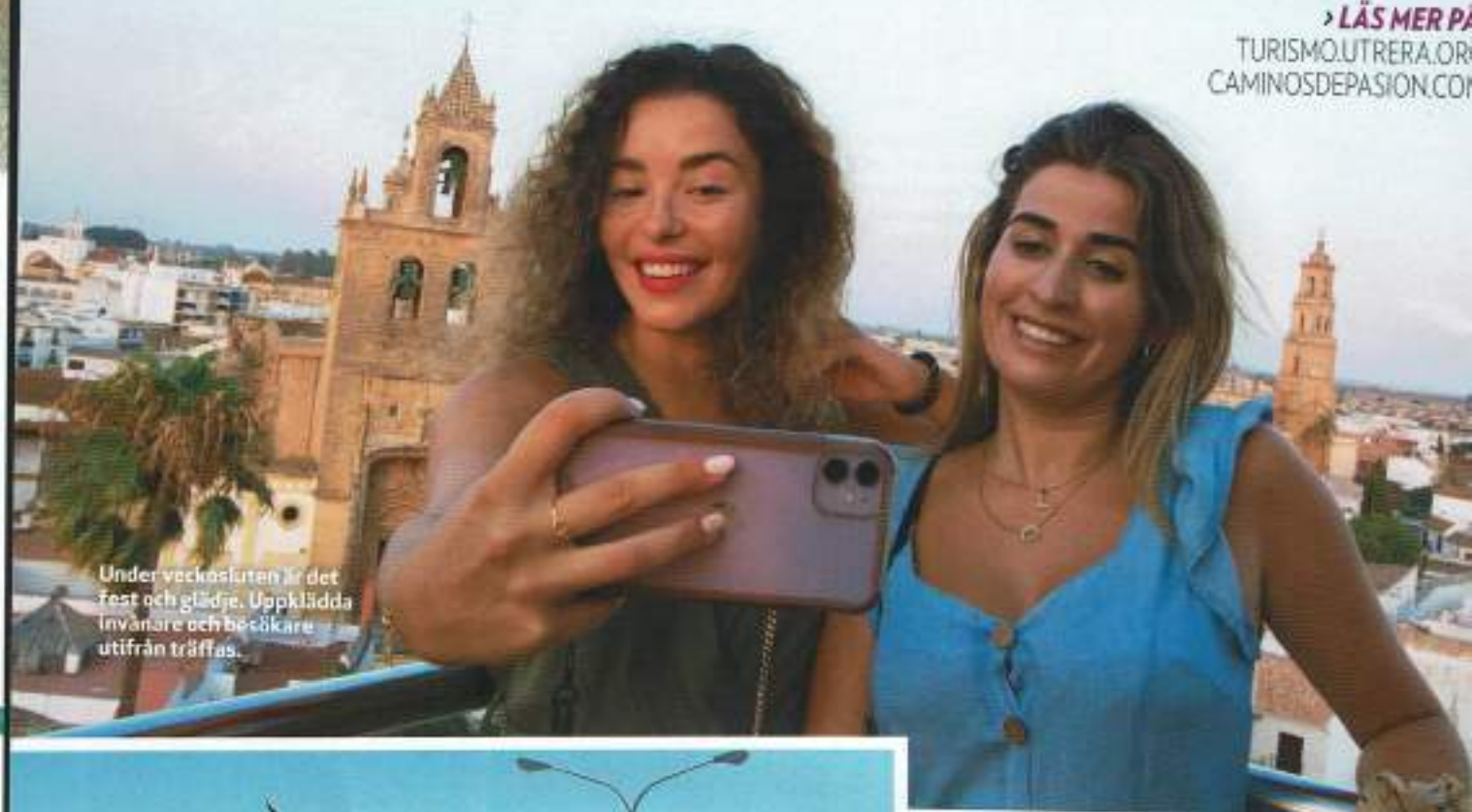
Under veckosluten är det fest och glädje. Uppklädda invånare och besökare utifrån träffas.