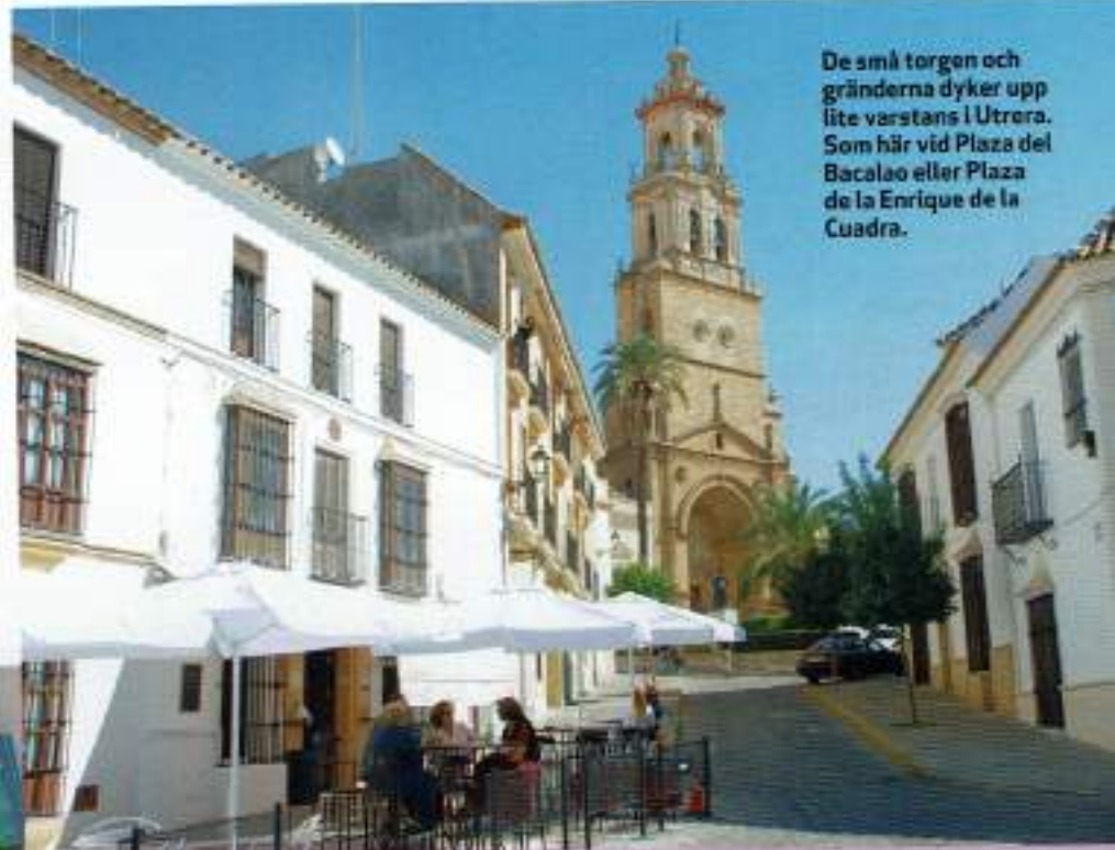
De små torgen och gränderna dyker upp lite varstans i Utrera. Som här vid Plaza del Bacalao eller Plaza de la Enrique de la Cuadra.