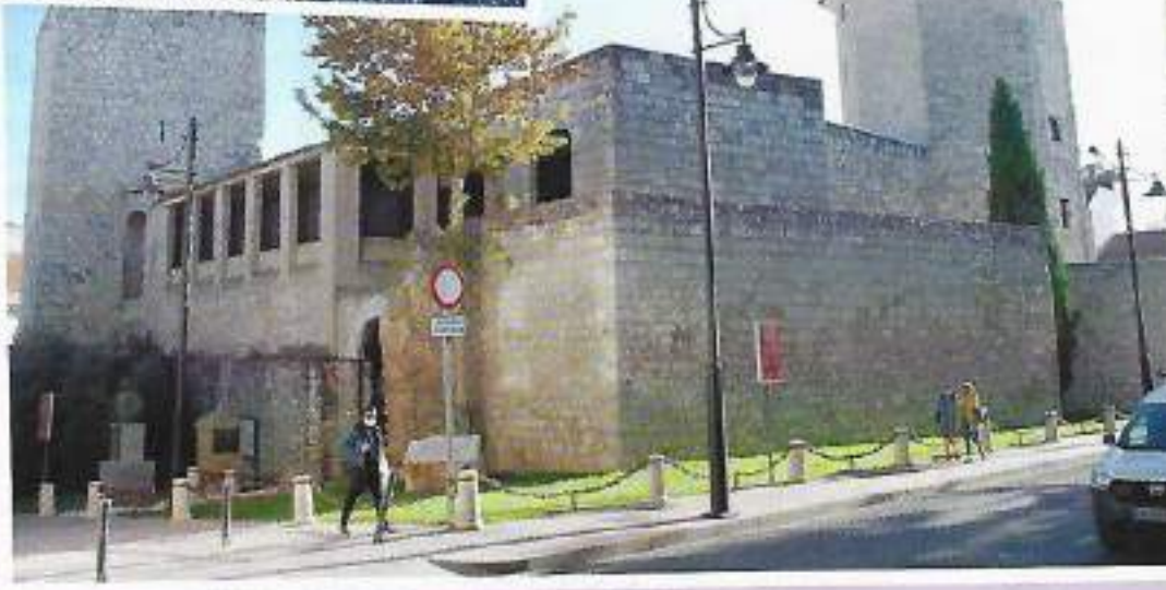
Castillo del Moral ligger vid Plaza Coso och är ett nationellt historiskt monument.

Coso och är ett nationellt historiskt monument. Den äldsta delen byggdes troligen under 1000-talet under stadens judiska period.