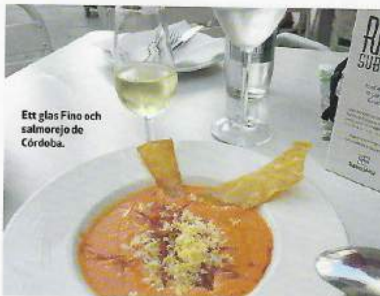
Ett glas Fino och salmorejo de Córdoba.

En av de äldsta bodegorna är Cañada Navarro som grundades 1860. Några andra producenter att studera på närmare håll är Lagar de los Frailes i Moriles Alto och Lagar Blanco. Lagar de la Salud, Lagar de Casablanca, Bodegas El Monte och El Lagar Cabriñana är ytterligare några producenter med guidade turer.