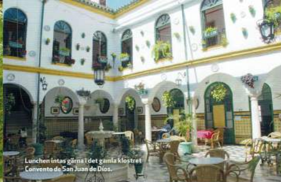
Lunchen intas gärna i det gamla klostret Convento de San Juan de Dios.