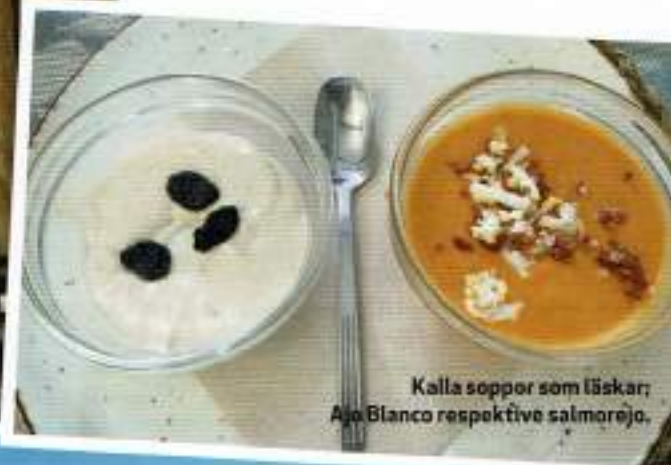
Kalla soppor som läskar: Ajo Blanco respektive salmorejo.

Ett litet stycke härifrån finns en trevlig uppställningsplats för husbilar. Strax intill ligger Auditorio Municipal Alcalde Juan Muñoz som ser ut som en romersk teater där det arrangeras konserter och kultur evenemang under sommaren.