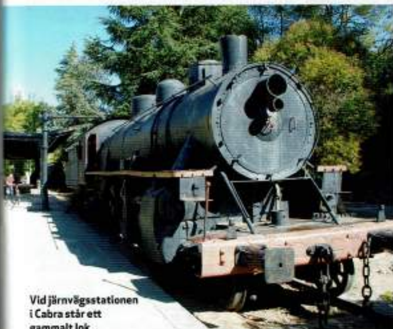
Vid järnvägsstationen i Cabra står ett gammalt lok.