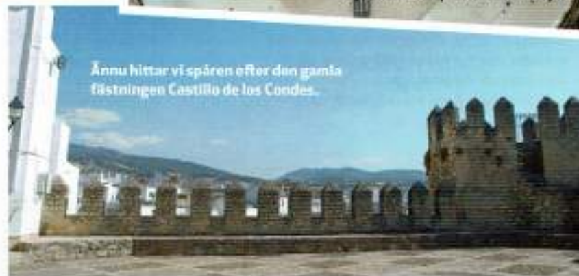
Ännu hittar vi spåren efter den gamla fästningen Castillo de los Condes.

Gastronomi: Du befinner dig i Córdoba-provinsen och då är den kalla soppan salmorejo med en glas vin från närbelägna Montilla-Moriles något att prova. Eller en "potaje" en matig rätt med spenat och kikärter.