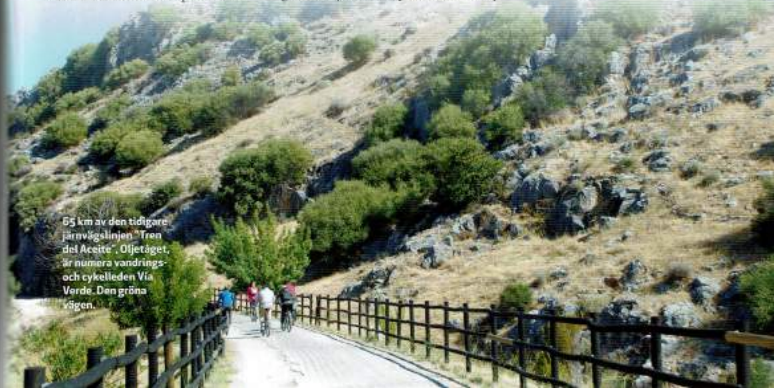
65 km av den tidigare järnvägslinjen "Tren del Aceite", Oljetåget, är numera vandrings- och cykelleden Via Verde. Den gröna vägen.

Under årens lopp har det utvidgats och renoverats. 1984 flyttade det till riksbankens tidigare lokaler vilket blev ett lyft. Museet ger en utmärkt bild av platsens historia och folkslagen som har kommit och gått.