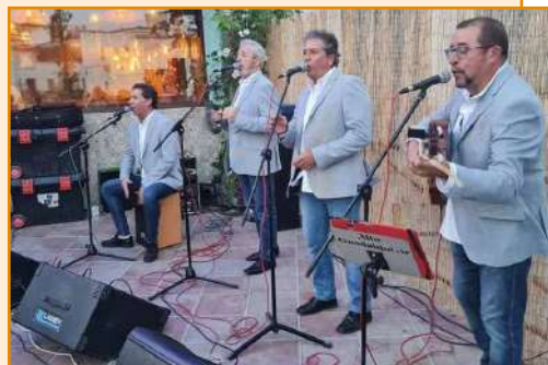
GRUPO ROCIERO ALTO GUADALQUIVIR

Los días 5, 6, 7 y 8 de septiembre las calles Alcalá Galiano y Cervantes permanecerán cortadas al tráfico para el montaje de la Feria al Mediodía a partir de las 13 h. y hasta el desmontaje y limpieza íntegra de las mismas a partir de las 18:30 h., quedando restablecido el tráfico a las 19:30 h. y desde esa hora hasta las 13 h. del día siguiente se mantiene la actividad normal en todo el trazado. Igualmente y durante los mismos días la C/ Julio Romero tendrá la dirección de tráfico al contrario del que habitualmente tiene.