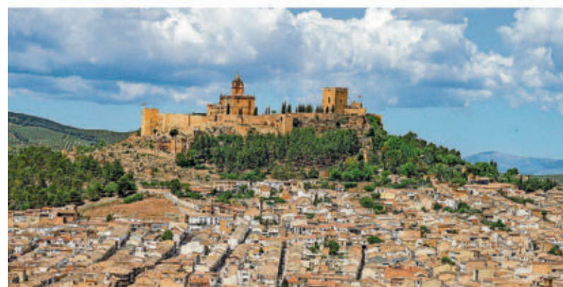
Die Maurenfestung La Mota überragt heute noch die weiße Stad Alcalá la Real.

höhe weit oben über dem Guadalquivir fanden sie bereits eine große Stadt mit mächtiger Mauer vor und wurden schnell heimisch. In der Ausgrabung von Torreparedones wurde eine Thermenanlage ebenso entdeckt wie Kaufmannshäuser und ein Gräberfeld. Auf dem Forum stehen drei kopflose Statuen und eine vergoldete Inschrift im Pflaster erinnert wie ein modernes Werbebanner an ihren Stifter. Wenn man Glück hat, tritt aus einem der Schatzen eine als Römerin gekleidete Einheimische mit einem kühlen Krug Honigwein. Von einem Turm aus der Maurenzeit reicht das Rundum-Pa-