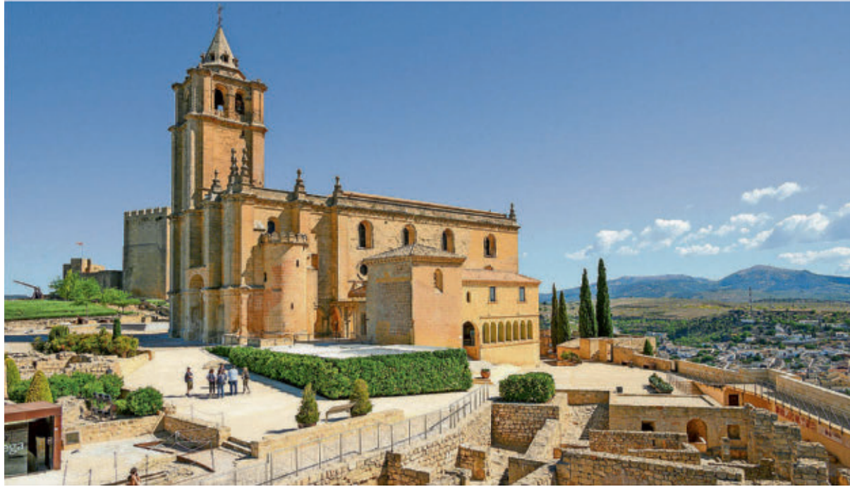
Eine christliche Kirche überragt die Maurenfestung La Mota in Alcalá la Real.

Utrera ist eine von zehn Kleinstadtpetern im Hinterland der spanischen Costa del Sol zwischen Malaga, Córdoba und Sevilla, die bei einer Rundreise durch Andalusien meist links liegengelassen werden. Von Carmona, Osuna, Lucena oder Priego de Córdoba hat im Ausland bislang kaum jemand Notiz genommen. Unter dem Motto „Caminos de Passion“ werben sie jetzt gemeinsam bei Reisenden um mehr Aufmerksamkeit. Ein gleichnamiger Wander- und Radweg ist fast fertig.