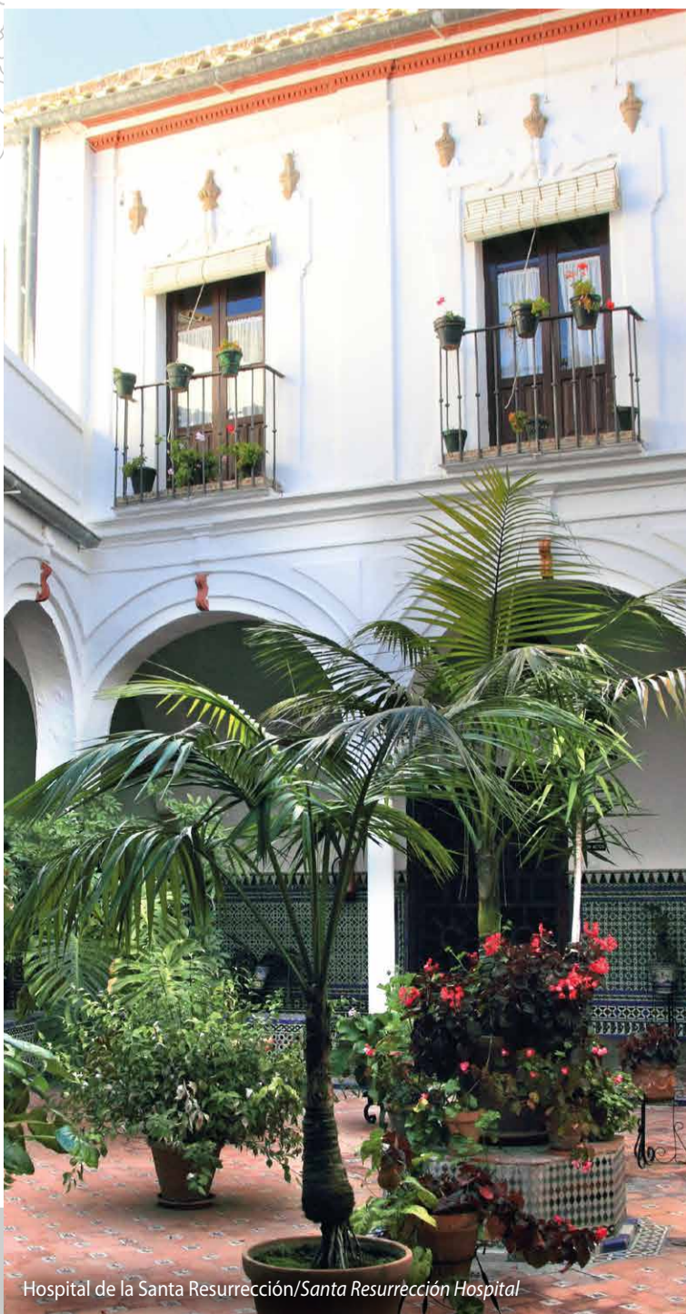
Hospital de la Santa Resurrección/Santa Resurrección Hospital