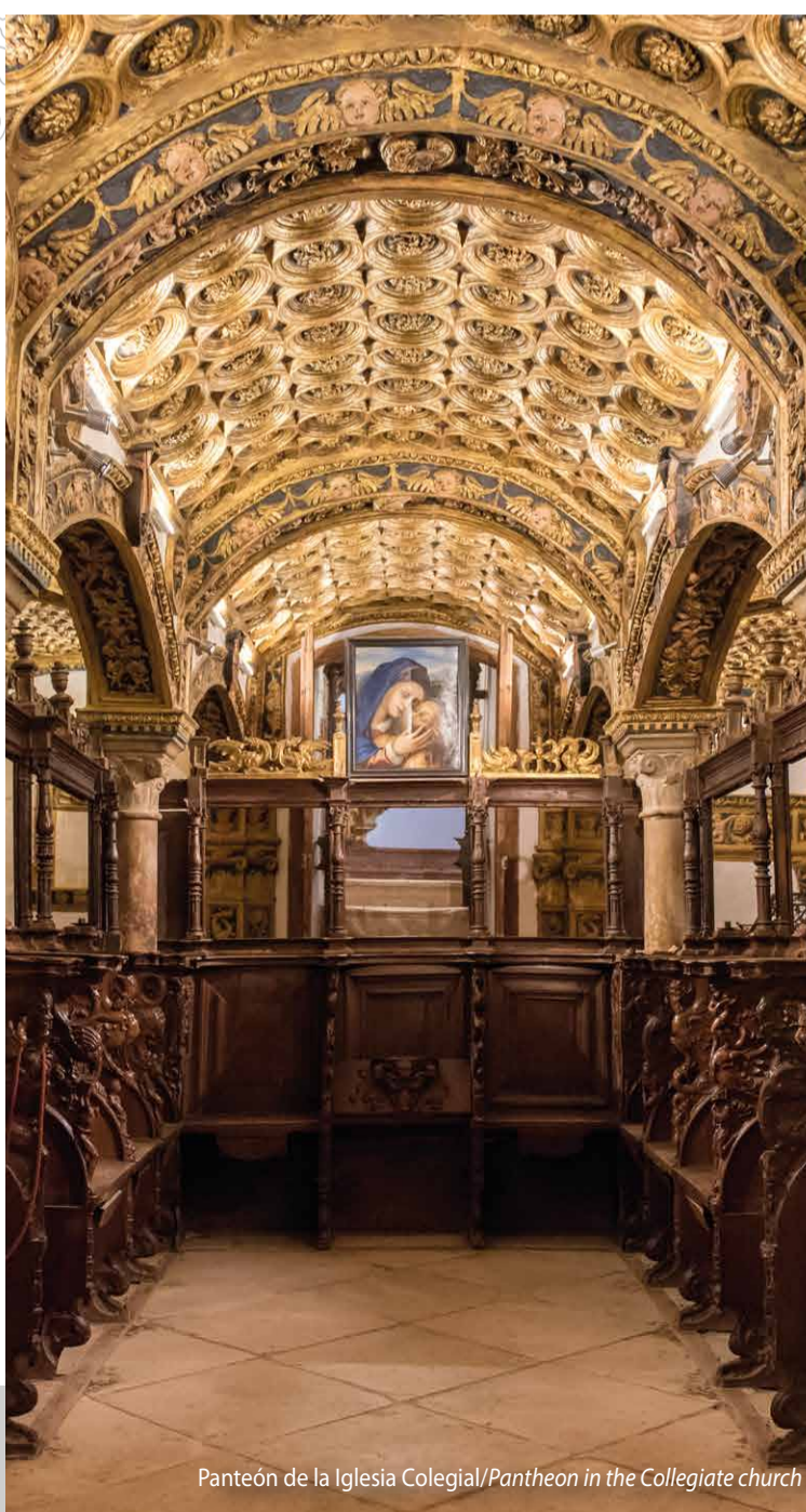
Panteón de la Iglesia Colegial/Pantheon in the Collegiate church