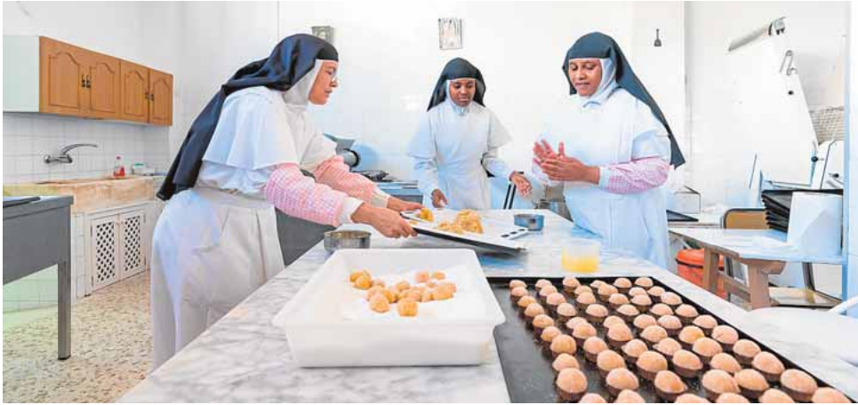
Monjas del convento de la Encarnación de Osuna elaborando dulces