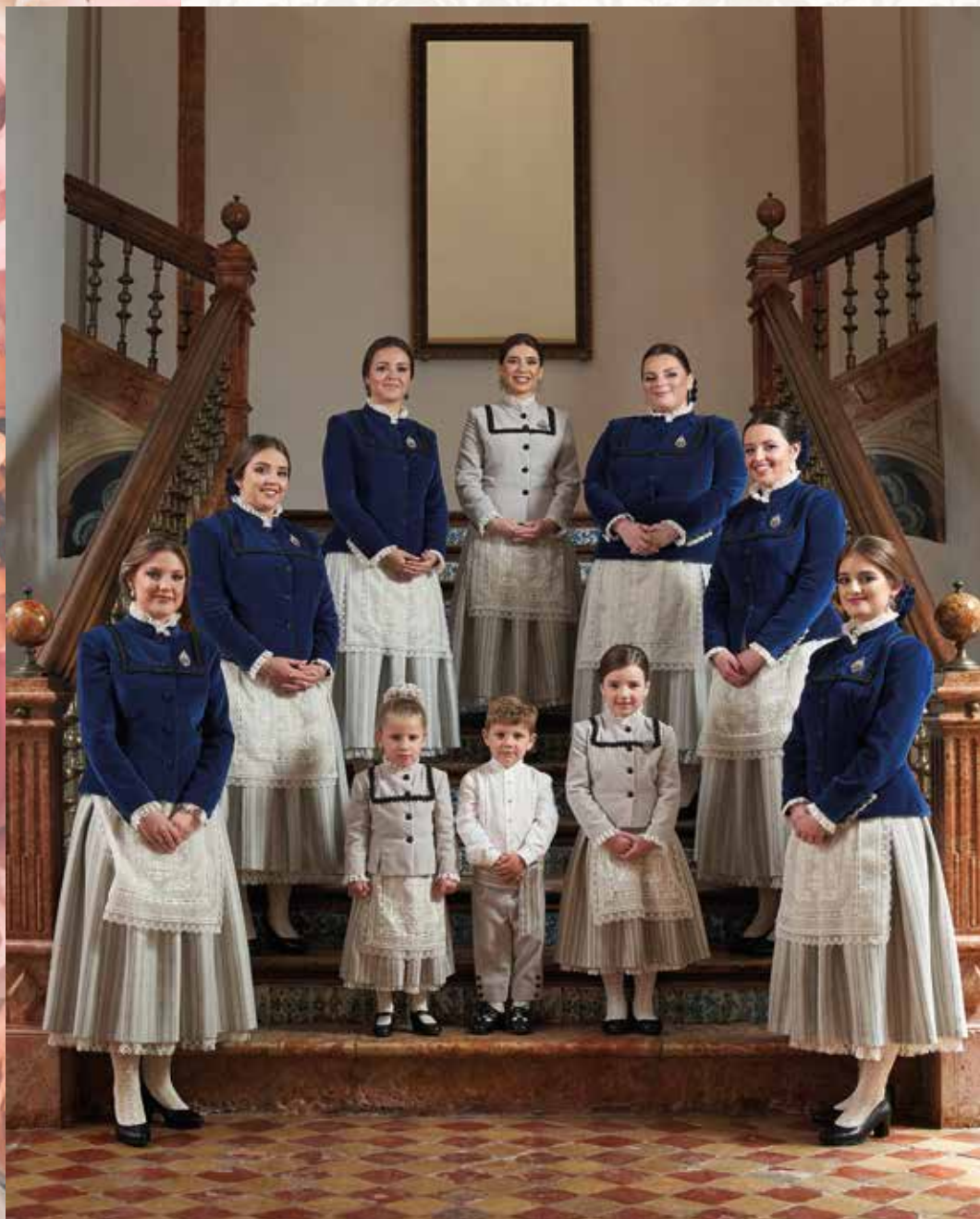
Aracelitana Mayor y Corte de Honor de María Santísima de Araceli